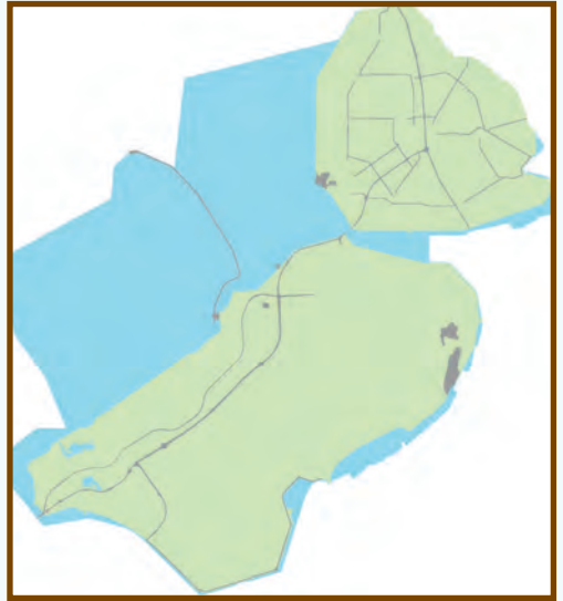
Bodemkwaliteitskaart ondergrond (0,5-2,0 m beneden maaiveld)