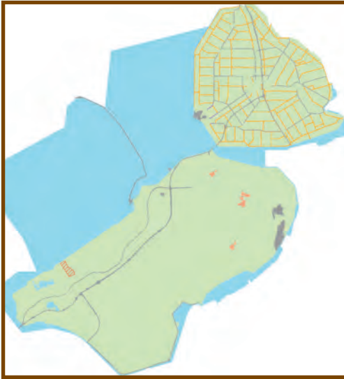
Bodemkwaliteitskaart bovengrond (0,0 tot 0,5m beneden maaiveld)